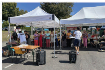
Forum des associations