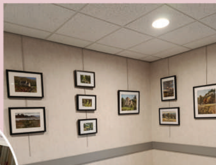
Exposition de pastels Florian Rouliès