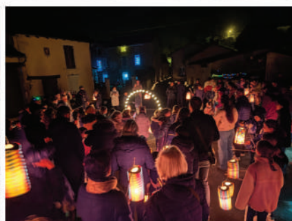
Illuminations de Noël