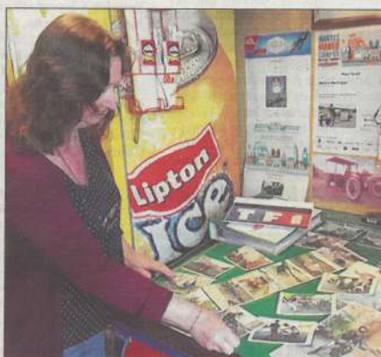
Sa mère n'hésite pas à sortir les photos de famille pour évoquer la passion de son fils.