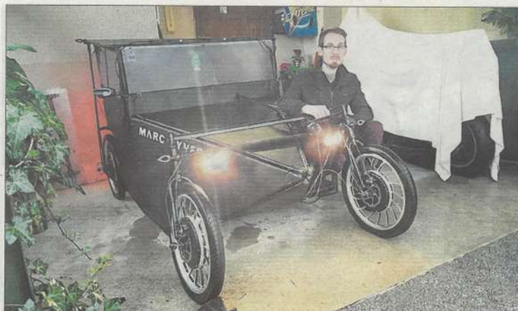
Il a construit de ses mains ce bolide 100 % électrique équipé comme un véhicule normal.

Philippine RENON redactiond@dordogne.com