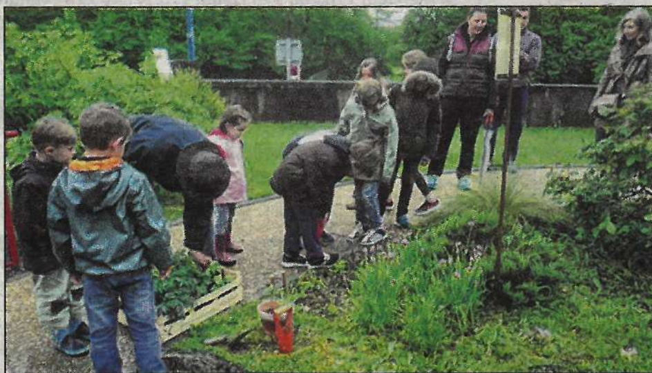
Les enfants de la commune ont participé à l'entretien des trois jardins participatifs de la commune.

C'est ainsi que les enfants pourront se nourrir des conseils civiques car ces jardins prendront tous leurs sens en se fondant sur des valeurs de solidarité, de convivialité, de lien et de partage entre les générations et les cultures. Pas besoin de savoir jardiner pour en faire partie. Que l'on ait quinze minutes par semaine pour arroser ou une heure par jour