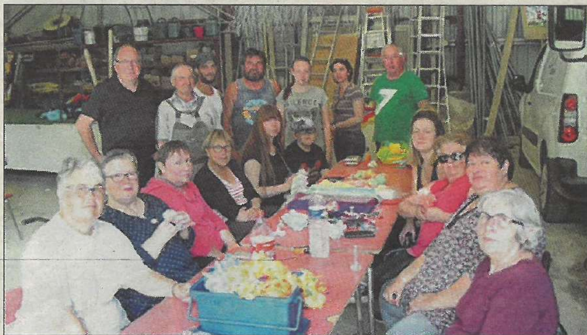
Les bénévoles sont prêts pour assurer le succès de la fête.

La fête communale d'Agonac se tient ce week-end. Le programme s'annonce riche et varié.