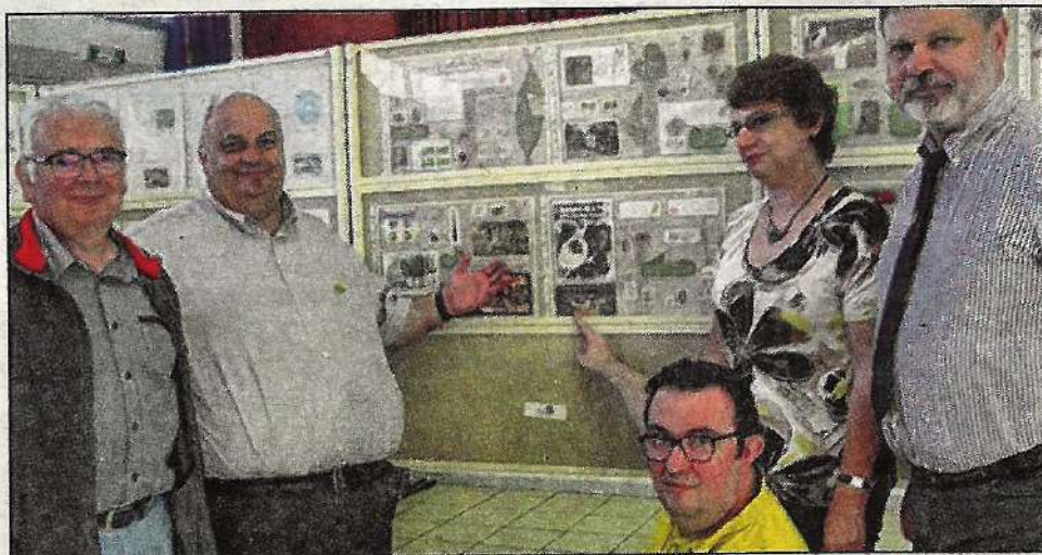
Une première exposition avant l'évènement de Timbre passion, du 26 au 28 octobre.

Plusieurs planches de timbres sur les thèmes Que la Montagne est belle et le Périgord y figuraient, et qui concourront à la Filature pour Timbre passion du 26 au 28 octobre. En amont un concours de dessin sur le thème La Maison De Tes Rêves a été organisé par les élèves de l'école primaire. Les dessins feront l'objet