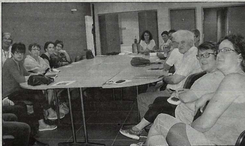
Les quatre prochains mois seront très animés sur Agonac.

Elle sera amenée à avoir d'autres implications dans la commune en accompagnant les porteurs de projets dans la logistique et la mise en œuvre de leurs événements, la finalité étant d'œuvrer